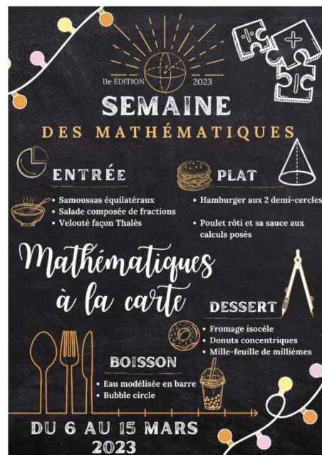
Les élèves de le 6 e Munich - Collège Bayard - DENAIN