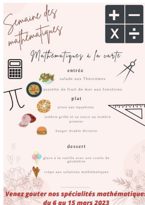
Gabriel, Raphaël - 3 e - Collège Rostand - LE CATEAU-CAMBRESIS

Je vous joins quelques exemples de telles affiches