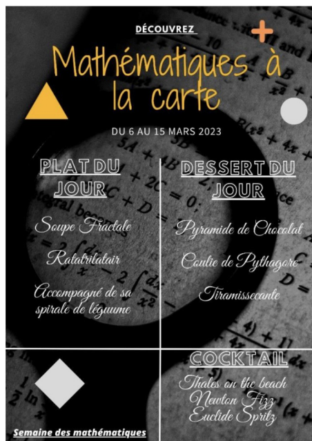
Nahil - 4 e - Collège Coutelle - MAUBEUGE